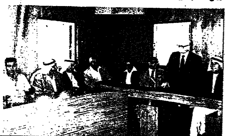
السيد اريخ و مرافقوه في الطيرة

وقال انه اجتمع يوم الثلاثاء الماضي مع السيد سمحان اريخ نائب رئيس الحكومة وبحث معه مسئلة من المواضيع المتعلقة بوضع المواطنين العرب في اسرائيل ، واضاف انه لم يتم اتخاذ قرارات معينة في هذا الاجتماع ، ولكنه اضاف انه لا يجب الاعلان عن التوايا في تنفيذ قراراته ، وانما يتم في المستقبل القريب جدا .